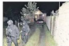
La madrugada de ayer, nueve personas fueron detenidas durante el operativo denominado "Muración", efectuado por la Policía Nacional y la Fiscalía con el fin de desarticular una presunta banda delictiva que estaría dedicada al robo en domicilios.