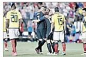
Fruto (BOLSA, CEJU). (EFE) • La selección de Ecuador derrotó a la TRI por 1-0, con un gol de Damián Flores a los 68 minutos, a la de Ecuador que jugó para conseguir más y se fue de Fruto con las manos vacías.