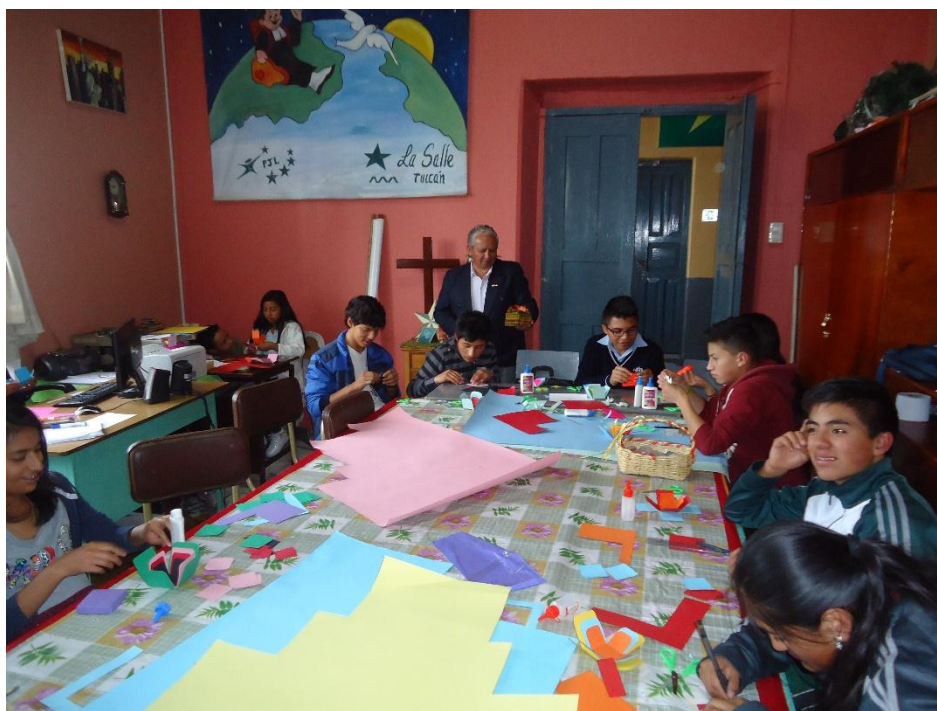
Estudiantes de la Unidad Educativa Hno. Miguel La Salle de Tulcán.

Compartiendo con el Sr Rector y los jóvenes de pastoral juvenil y vocacional.-