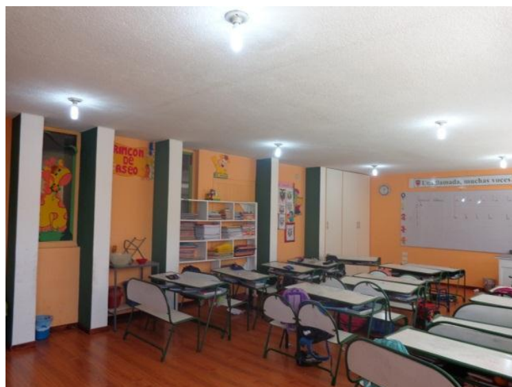
Aulas – Prefabricadas: