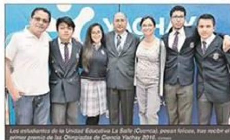
Los estudiantes de la Unidad Educativa La Salle (Cuenca), posan felices, tras recibir el primer premio de las Olimpiadas de Ciencia Yachay 2016.